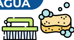
Espanja, vassoura, bucha ou escova (não podem ser de aço!)