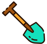
Pá de plástico

Água sanitária 2,0% a 2,5% (que não tenha essência/corante) ou hipoclorito de sódio 2,5%