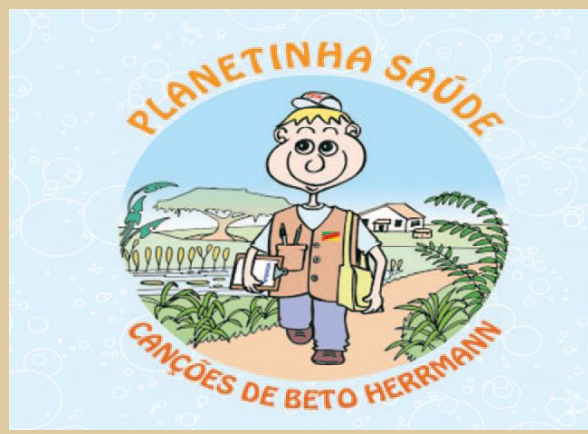
Figura 7 - Capa do CD Planetinha Saúde.

Além disso, um mascote para o projeto, chamado "Hidronildo", foi criado para ser utilizado nas atividades que envolvam educação em saúde, como forma de chamar a atenção das crianças de maneira lúdica (Figura 8). O mascote fez parte da 1ª faixa do CD com o título: "Hidronildo - o Vigilante da Saúde", e participou de todos os eventos que envolviam o VIGIAGUA-RS.