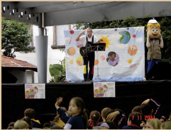
Figura 11 - Semana da leitura falando sobre Água e Saúde - Garibaldi.