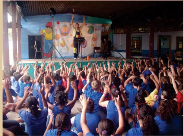
Figura 13 - Evento em Gravataí.