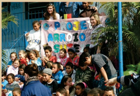
Figura 9 - Evento falando sobre o Arroio/Alvorada.