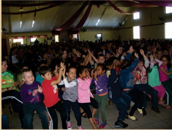
Figura 10 - Evento em Passo do Sobrado.