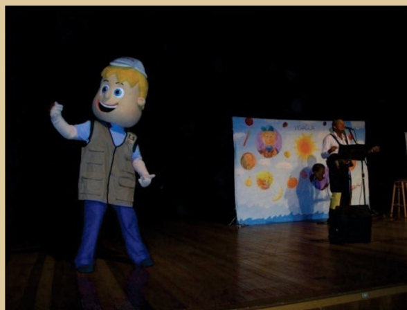
Figura 8 - Mascote Hidronildo interagindo nas apresentações.