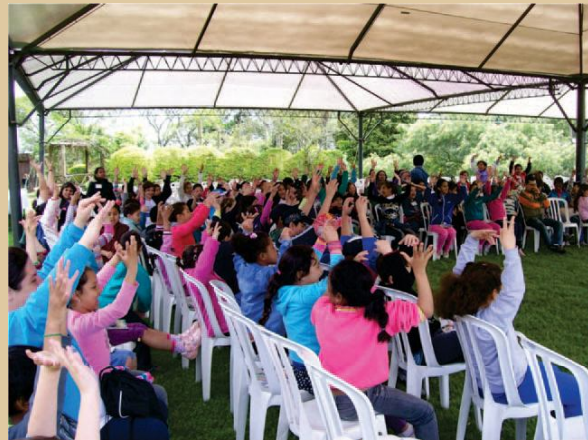
Figura 14 - Semana Estadual da Água - Viamão.