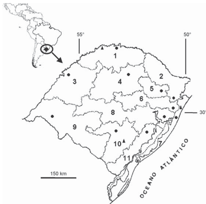
Figura 1: Zonas fisiográficas do Rio Grande do Sul (segundo Arend, 1997), com os locais onde foram realizadas as coletas. 1 - Alto Uruguai: ● Iraí , ▲ Derrubadas ; 2 - Campos de Cima da Serra: São Francisco de Paula ; 3 - Missões: Santo Antônio das Missões ; 4 - Planalto Médio: Ernestina ; 5 - Encosta Superior do Nordeste: Caxias do Sul ; 6 - Encosta Inferior do Nordeste: Santo Antônio da Patrulha ; 7 - Litoral: ▲ Osório , ● Cidreira ; 8 - Depressão Central: Viamão ; 9 - Campanha: Quaraí ; 10 - Serra do Sudeste: ● Caçapava do Sul , ▲ Piratini ; 11 - Encosta do Sudeste: Camaquã .

Devido ao caráter exclusivamente qualitativo do trabalho, os locais de coleta foram escolhidos tentando contemplar diferentes habitats, em condições climáticas diversas. Para tanto, as capturas foram levadas a efeito em pontos aleatórios nas 11 zonas fisiográficas do Estado (Fig. 1), definidas por Arend (1997) em função das semelhanças físicas, climáticas, topográficas e fitogeográficas. As caracterizações destas zonas baseiam-se em Vieira & Rangel (1984) e Lema (2002).